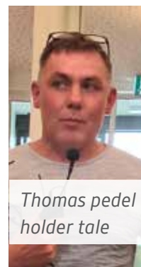
Thomas pedel holder tale