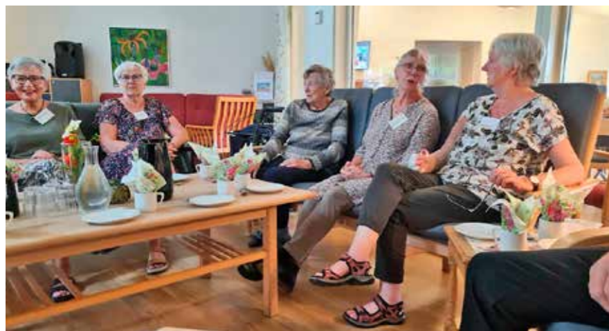
Frivillige tager et hvil

Jeg er gruppeleder med stedfortræderfunktion. Jeg sidder også med vagtplaner. Der er altid områder, hvor vi kan udvikle os og blive bedre. Det vil jeg gerne medvirke til. Jeg er rigtig glad for at være her. Stemningen er noget helt særligt. Den indsats, også de frivillige gør for stedet, er helt enestående. Man kan måske synes, at det er en lille ting, at der er blomster i vaserne, at ukrudtet er væk fra bedene, at der pyntes op til begivenhederne osv., men det betyder så meget. Perso-