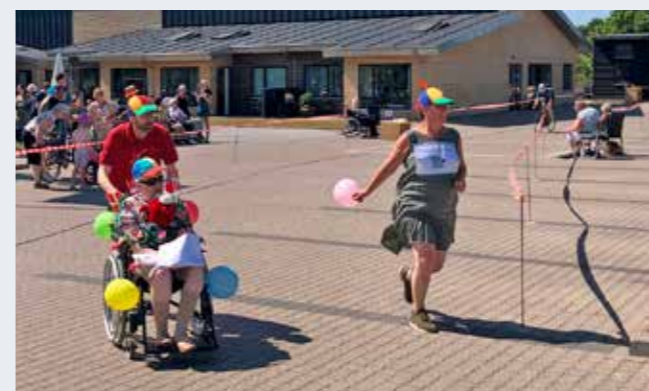
Team Irma i skarp løb