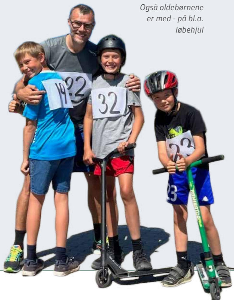
Også oldebørnene er med - på bl.a. løbehjul