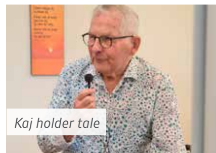
Kaj holder tale