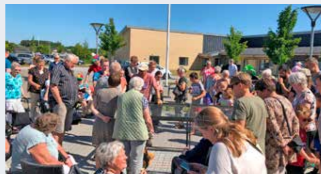
Årets idé... hønseskidning