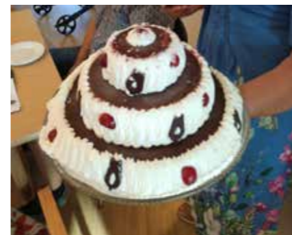
Så er der is fra Vebbestrup