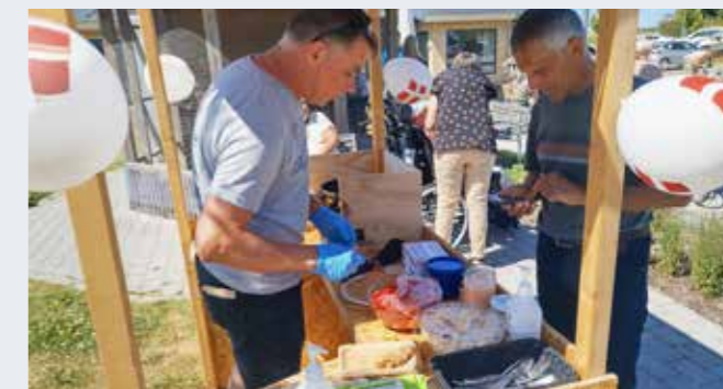
Thomas bager pandekager