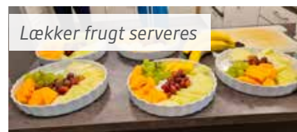
Lækker frugt serveres